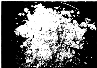
สมุนไพรรอบตัว