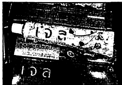
ผลิตภัณฑ์เจลสูตรลูกประคบ